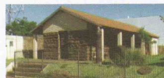
MUSEU MONSENHOR ESTANISLAU WOLSKI